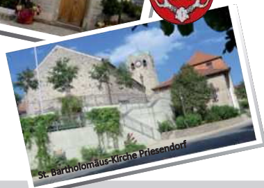
St. Bartholomäus-Kirche Priessendorf