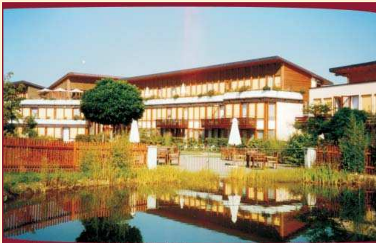
Geborgenheit, liebevolle Betreuung und fürsorgliche Pflege

Ein freundliches Wort, eine Umarmung, ein herzlicher Händedruck - in unserem Hause ist das keine Seltenheit.