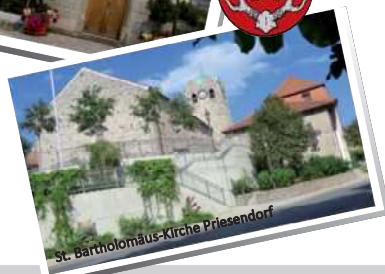
St. Bartholomäus-Kirche Priesendorf