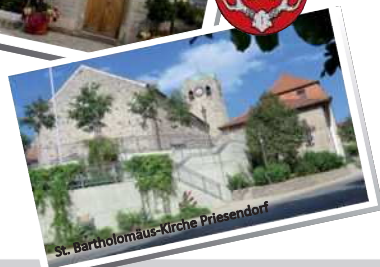
St. Bartholomäus-Kirche Priesendorf